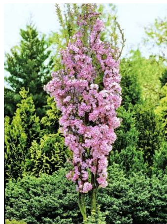
Prunus serrulata 'Amanogawa'