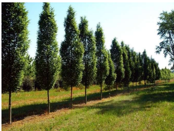
Carpinus betulus 'Fastigiata'

Pre riešenie plochy boli navrhnuté vzrastlé dreviny, ktoré zaujmú svojim habitusom a sú vhodné do užších priestorov ( Carpinus betulus 'Fastigiata', Prunus serrulata 'Amanogawa'), prípadne dreviny so zaujímavým sfarbením ( Acer platanoides 'Drumondii'). Navrhované boli: